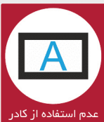
عدم استفاده از کادر