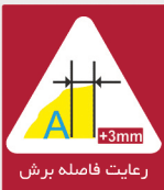
رعایت فاصله برش

در این محصول قابلیت سفارش تا سایز ۴۸۰x۳۴۰ میلی متر را خواهید داشت اما سایز های بزرگ تر از ۸ لات ( تقریباً ۸۵x۸۵ با ) طبق قوانین مجتمع مرجوعی خواهد داشت.